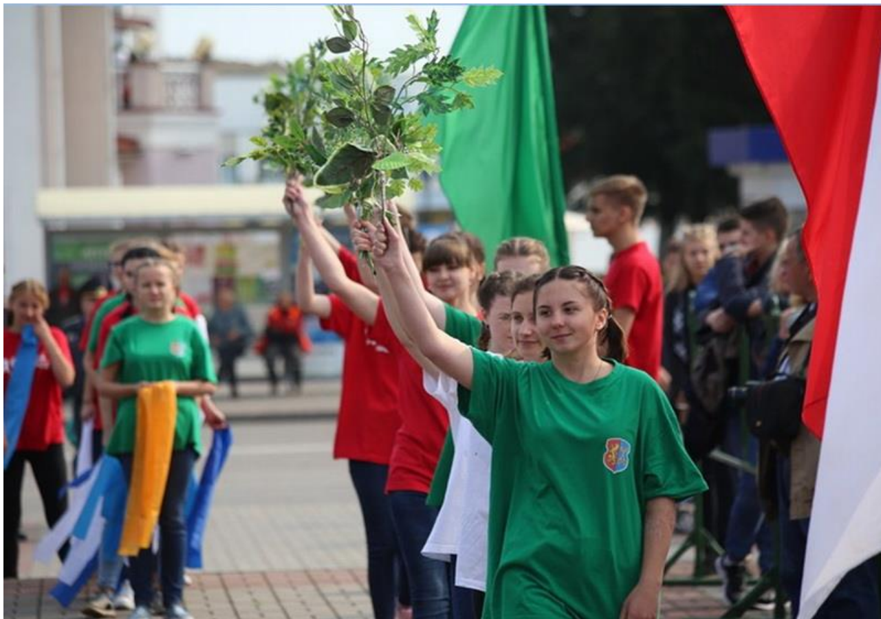
«Любимый сердцу город»

9 сентября 2017 года учащиеся колледжа приняли участие в театрализованном открытии праздника города Лиды