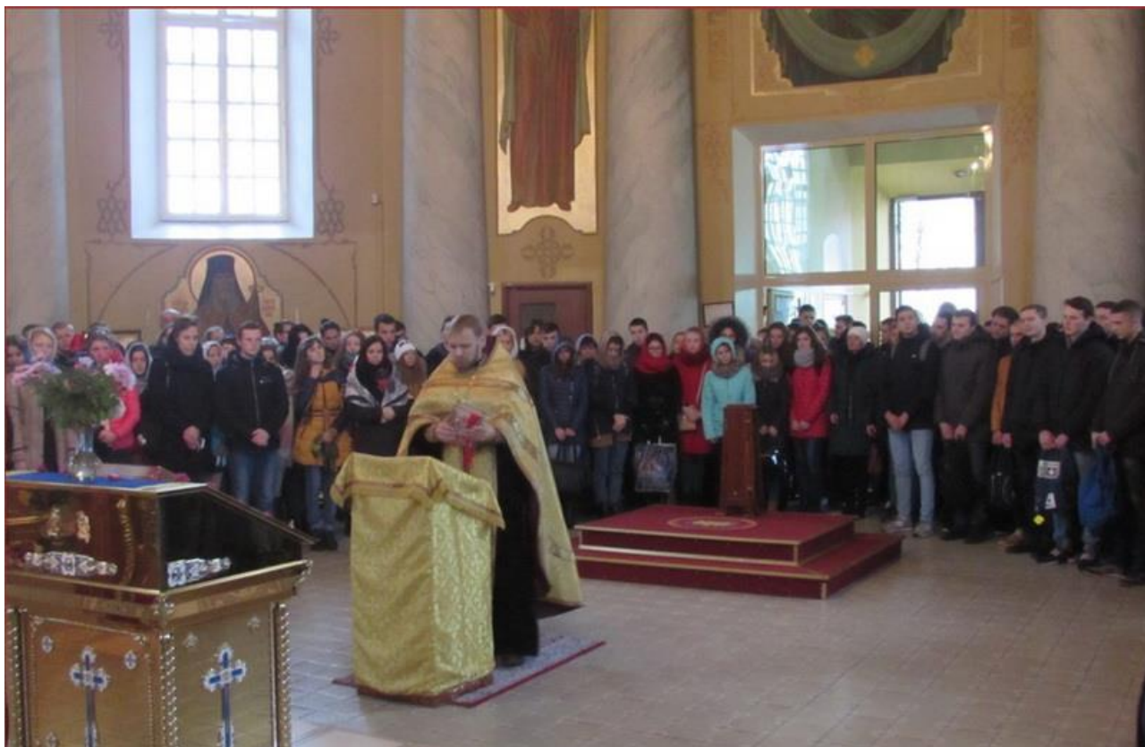
Фарный костел г. Лида, где состоялись молебны за матерей.

15. 11. 2017 года учащиеся и преподаватели колледжа посетили Свято-Михайловский кафедральный собор и