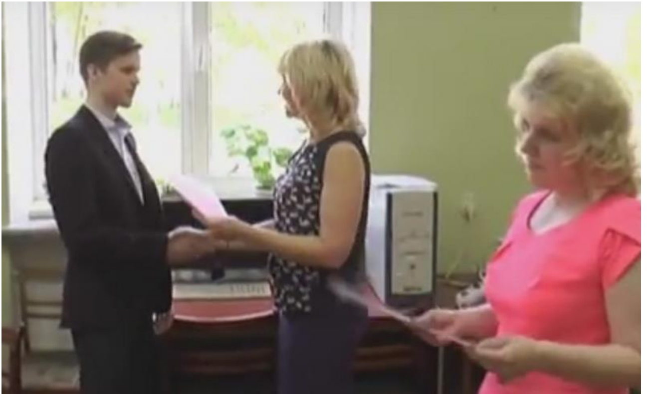
10 июля 2017 года в Лидском колледже прошла торжественная церемония вручения стобальных сертификатов.